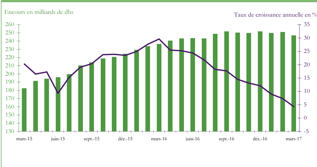
Graphique 3 : EVOLUTION DES RESERVES INTERNATIONALES NETTES